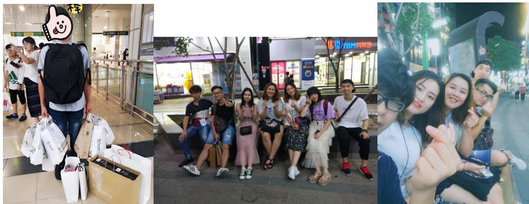
图 8 除了学习，购物也使我们快乐