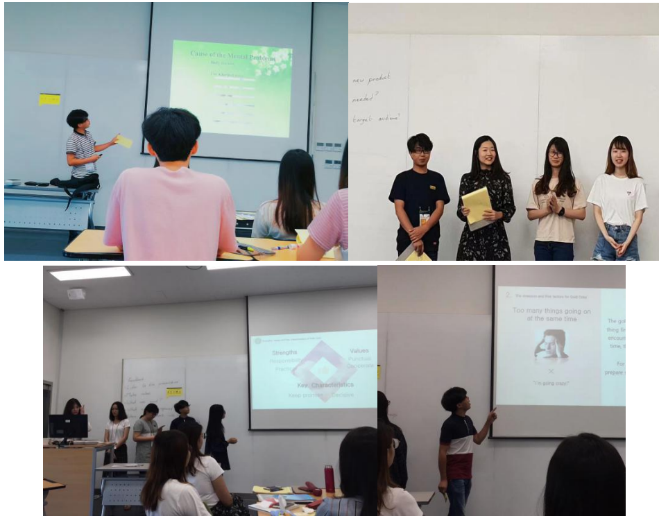
图 5 交流期间我的一些演讲练习照片

第二，国外老师很注重对学生学习效果的反馈。你每一次的练习，老师都会认真听而且记录，抓住你的优点表扬你，对于你的不足委婉地提醒你，鼓励你下次改进。第三，国外的学生也不是没有家庭作业的，每天也要写很多作业，比如每天要写日记反馈给老师，包括你今天学到了什么、你觉得自己表现怎么样、你觉得还有什么地方需要改进、你是如何使自己与他人不同的等等。这二十天来让我养成了每天写英文日记的好习惯，不仅做到“吾日三省吾身”，而且对提高自己的英语水平也有帮助。我会继续保持这样的习惯。