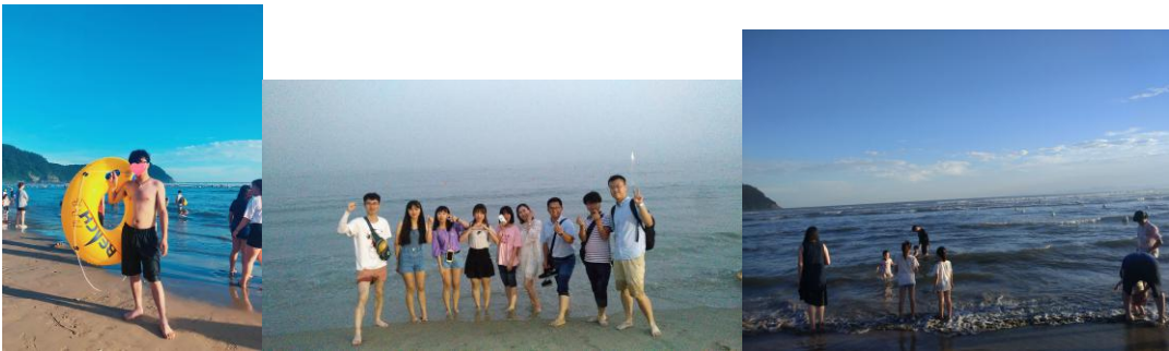
图10 第一次见海是在釜山的海云台