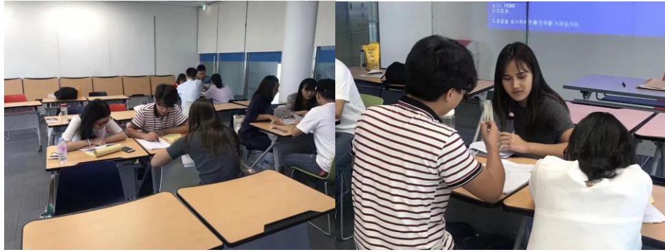
图 6 我与外国同学的课堂讨论