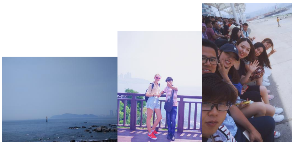
图 12 City tour