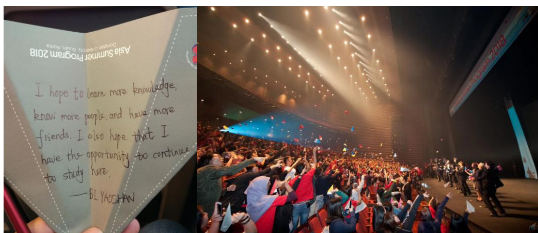
图 14 放飞梦想的纸飞机

记得当时 ASP2018 开幕式上，东西大学特别有心地为我们每一个师生都准备了一支纸飞机，让我们在上面写下自己的希望与梦想，然后大家一起放飞自己的梦想。