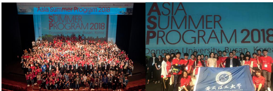
图 1 2018 ASP 开幕式大合影