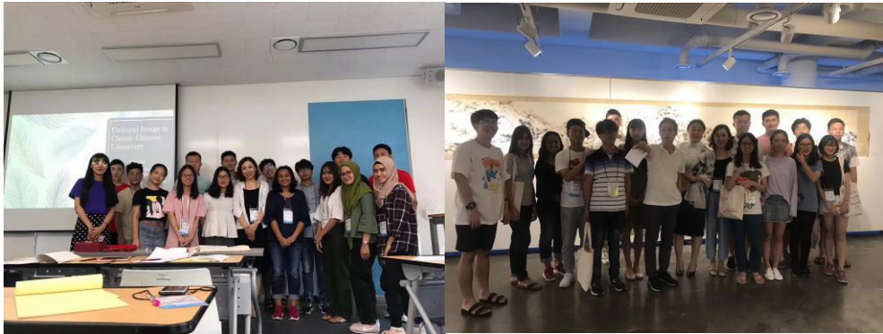
图 7 班级同学合影