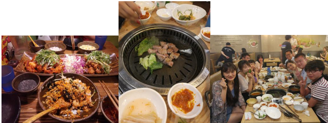
图11 韩国的美食不可辜负